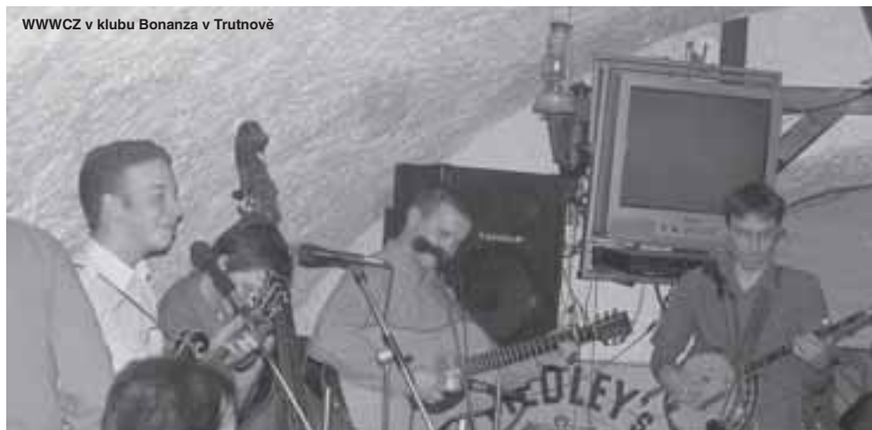
WWWCZ v klubu Bonanza v Trutnově