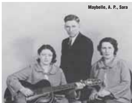
Maybelle, A. P., Sara

Vybral jsem si zmíněný úryvek právě z toho důvodu, že právě 1. srpna 1927 společnost Victor natočila právě tuto píseň a právě v podání tria A. P. Carter, Sarah a Maybelle . Proč právě tohle trio? Proč právě Carter Family ?