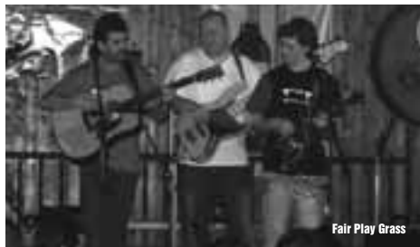
Fair Play Grass