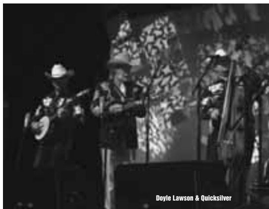
Doyle Lawson & Quicksilver