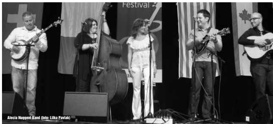
Alecia Nugent Band