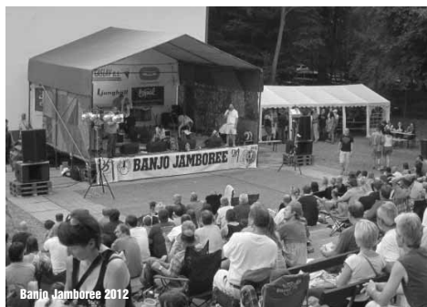
Banjo Jamboree 2012