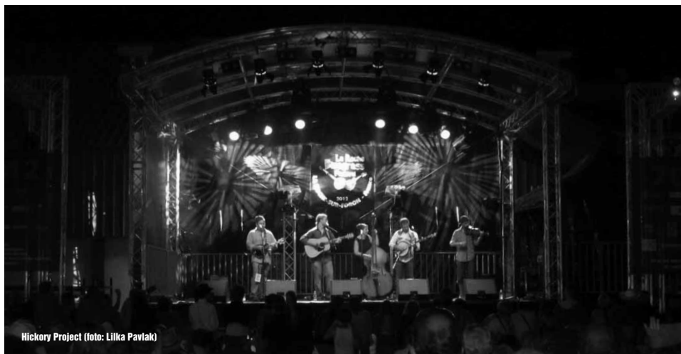
Hickory Project