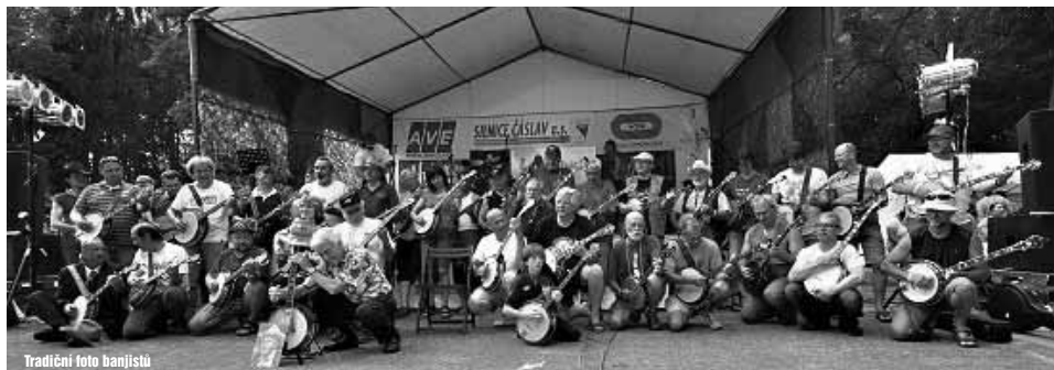
Tradiční foto banjistů