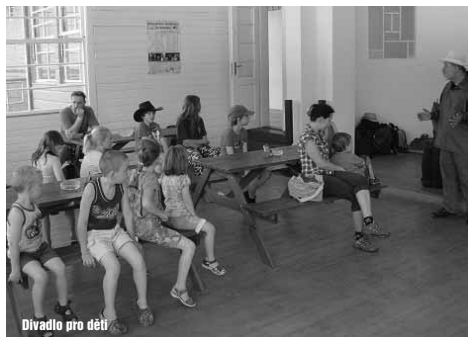
Divadlo pro děti