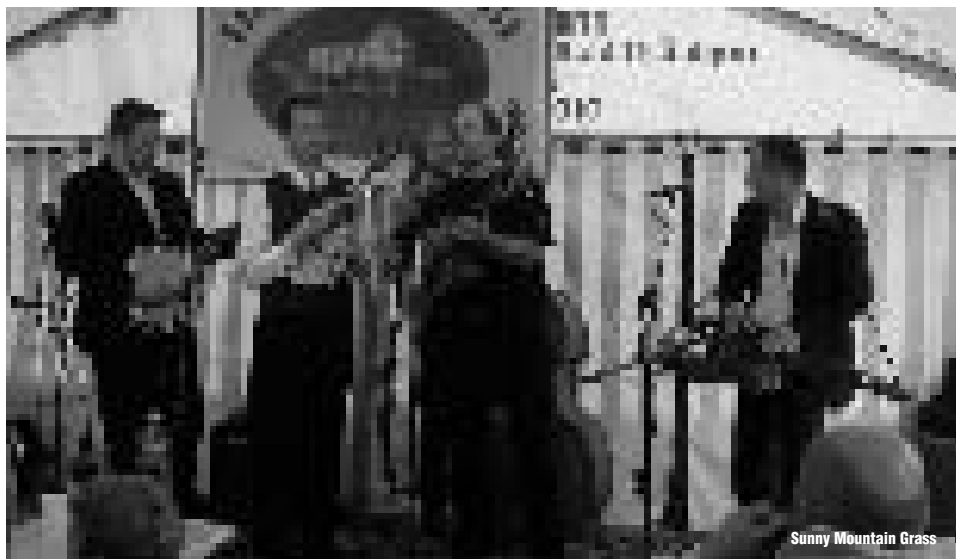
Sunny Mountain Grass