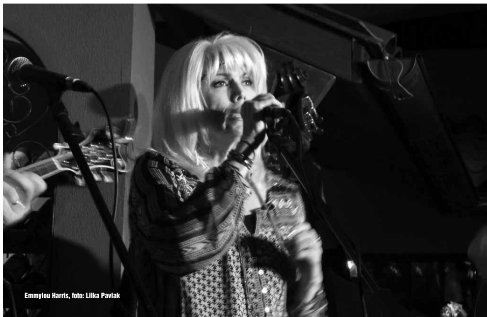
Emmylou Harris

Seldom Scene se vrátili s velkolepou show na svou první scénu, která se před víc než čtyřiceti lety stala jejich domovem. Dřív prý sice bylo podium na protější straně u okna, ale mnohé