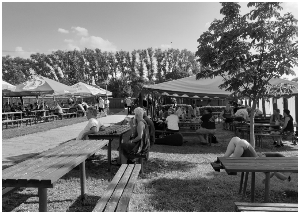
BG na vinici, areál

Musím pochválit to, že pivo se na festivalu čepovalo do skleněných půllitrů (dokonce nachlazených v mrazáku!) a ne do měkkých plastových kelímků, na což jsme u většiny podobných akcí zvyklí.