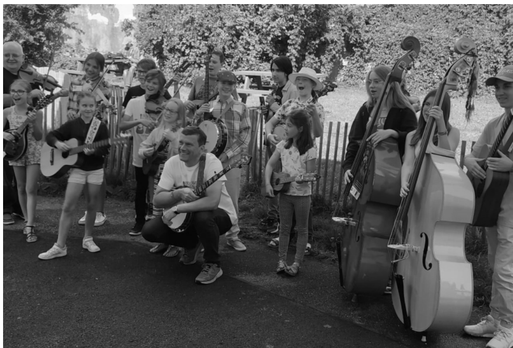
O budoucnost bluegrassu se nemusíme bát.

Kromě nás vyučujících a vystupujících zavítalo na festival také několik desítek návštěvníků z ČR. Tím se konečně dostávám k nadpisu tohoto článku. La Roche (z Prahy cca 1 000 km) leží v krásné krajině pod Alpami, vrcholky kolem mají kolem dvou tisíc metrů. Do Ženevy je to 20 km, poblíž je i Chamonix.